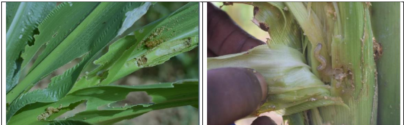
Kunuwan masara da tsutsar ta huhude