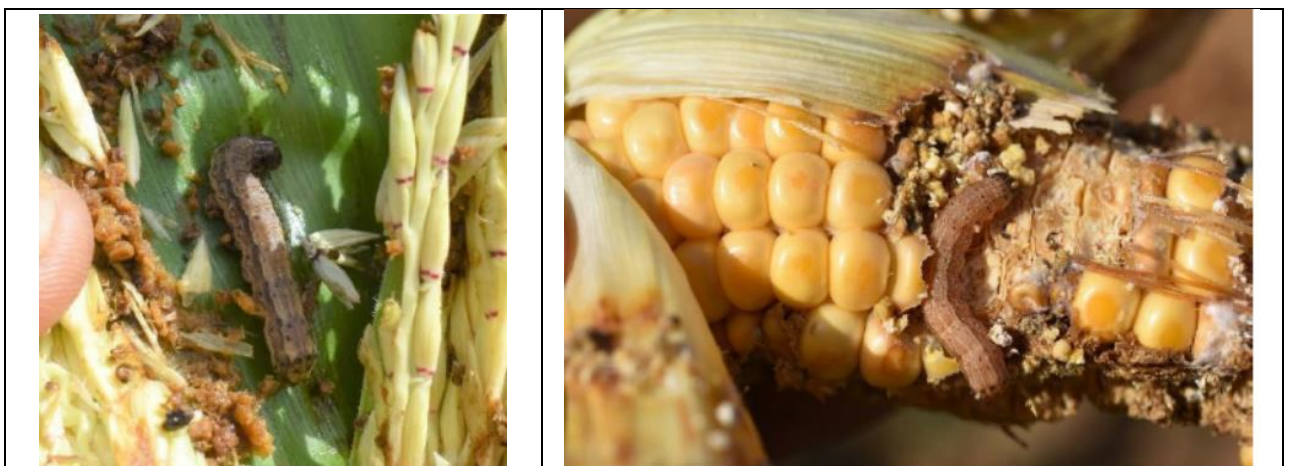
Tsutsa kewaye da kashinta (bilbidin)