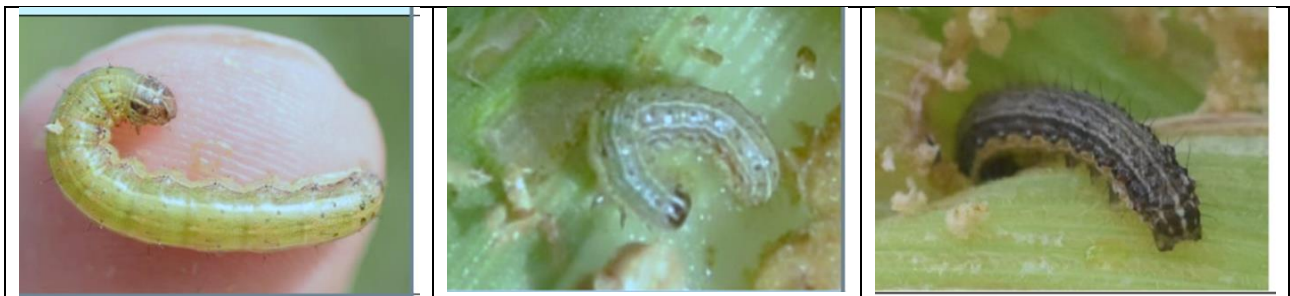
Launi daban daban na tsutsa a aji na farko