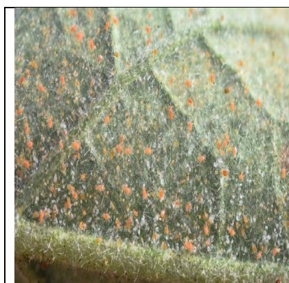
Foto1: Dadara kira kango aubergine koptey kire