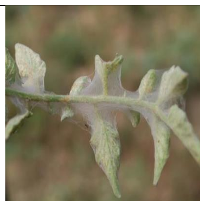
Foto3: Dadara fuwo kango tomati kopto ga