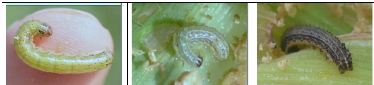
Noonizo corey barmahan

Daboro na fota gune noonizo gonda geerize yan gahamo ga. wodin banda boro gadi geerize fondo fay bon bindora da noonizo to nga beera me akuyano aga to 3cm aga kinga gaham kuru barmey gate haari say iwala mo goro hari.