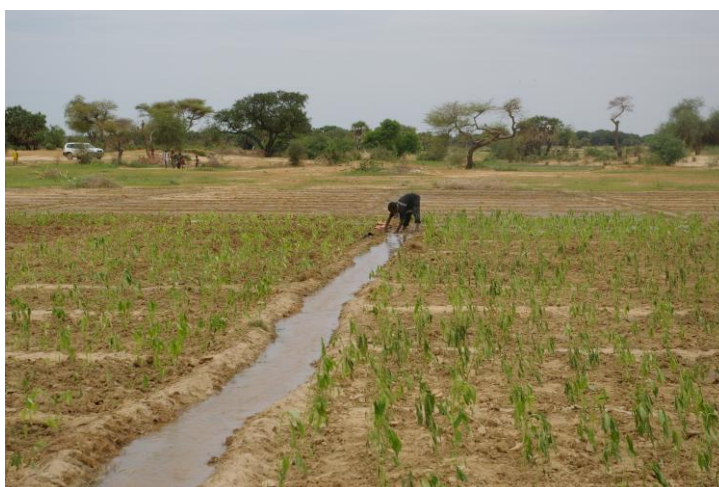
Repiquage le matin, malgré une irrigation rapide, les plants commencent à souffrir de la chaleur et du soleil.