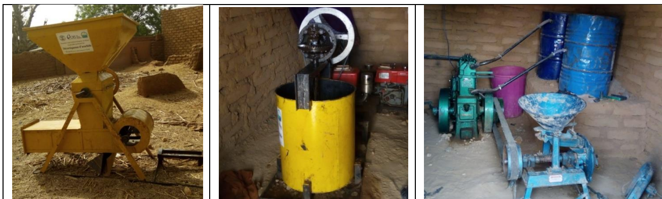
Décortiqueuse, presse et moulin du groupement Tatali acquis avec l'appui du CRS

Malgré la première formation reçue par la CRA dans le cadre du PASR, le groupement ne tient pas de comptabilité des recettes et des dépenses pour ces différents équipements. Cet aspect n'est pas pris en compte par le CRS. Dans le cadre de sa convention avec l'ONG Nigetech pour accompagner les acteurs des chaînes de valeur sur la comptabilité simplifiée, la CRA prendra en compte ce groupement de femmes afin de les aider à pérenniser les investissements et professionnaliser leur activité.