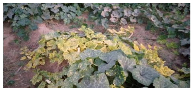
Photo 6 : développement de la maladie avec jaunissement des toutes les feuilles