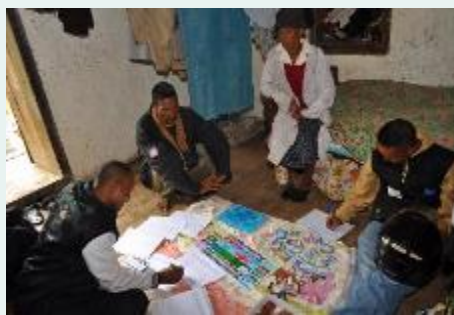
Madagascar – Séance autour du Monopoly