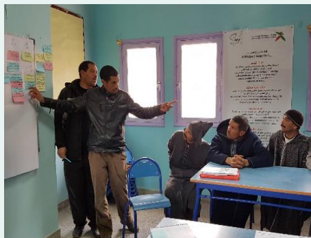
Maroc – Bilan de campagne