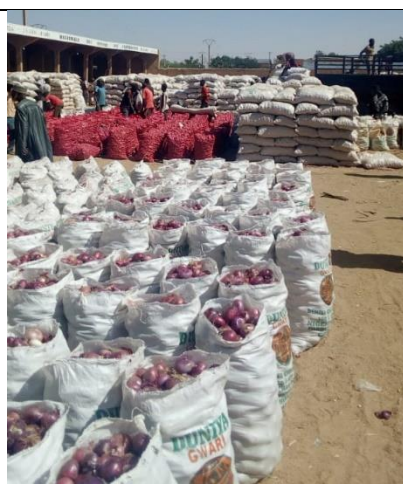
Mise en sac d'oignon