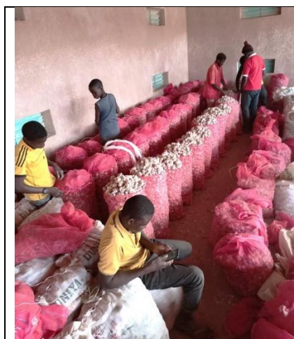
Mise en sac de l'ail