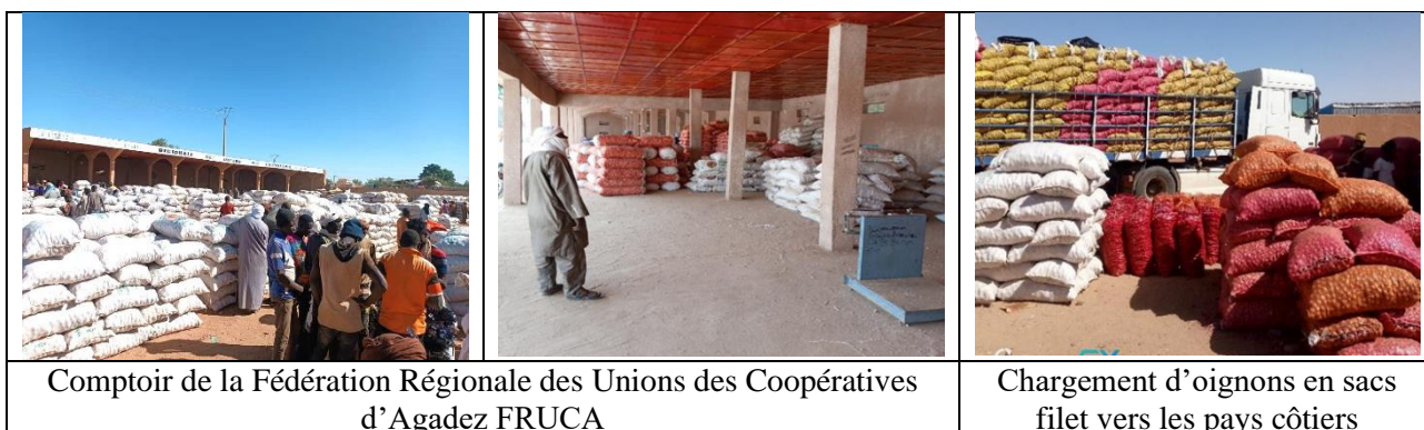
Comptoir de la Fédération Régionale des Unions des Coopératives d'Agadez FRUCA

L'agriculture et l'élevage sont les principales activités de la population rurale de la Région d'Agadez. L'agriculture est concentrée dans les vallées de l'Air (le long des Koris), l'Irhazer, le Tamesna, et les oasis du Kawar. C'est majoritairement une agriculture irriguée. Les principales spéculations sont l'oignon, la pomme de terre, l'ail, le blé, les dattes, les agrumes, les épices. Les productions d'Agadez sont disponibles à des périodes qui ne rentrent pas en compétition avec les autres régions du Niger. C'est notamment le cas pour la production d'oignon.