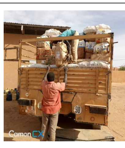
Arrivage cartons d'agrumes