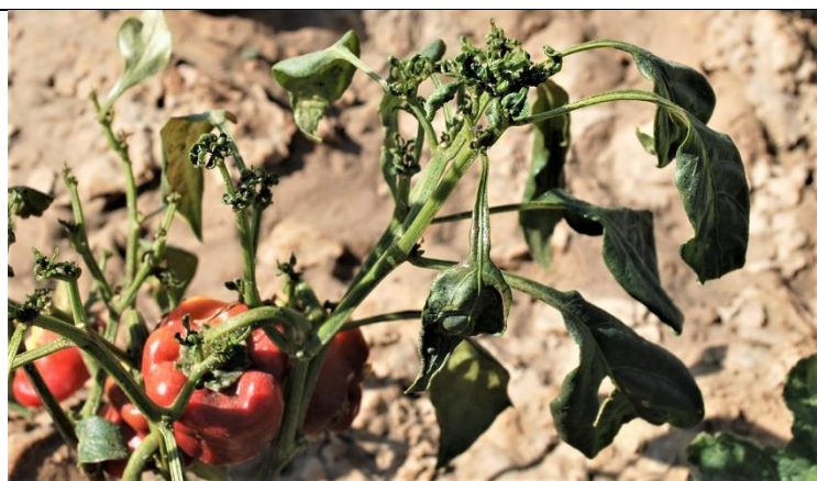
Hamniize kwaara alaamey tattaasa ga