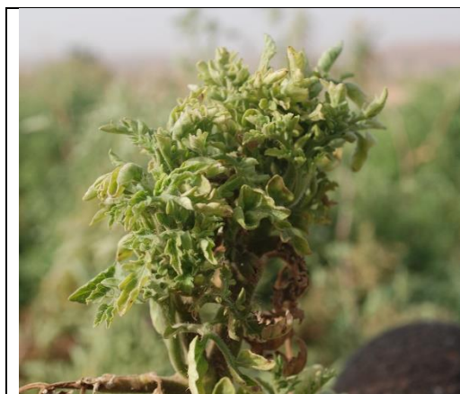
Hamniize kwaara alaamey tomaato ga

Ihinkanta, mate kaù sobora ga heemariizo dooro daù boro ga, ya-din no hamniize kwaaray wo ne mo ga hin ga doori yaù daù dumiizey ga, waati kulu kaù a na dumiizey din nama ga haro kaù ga ti a ùwaaro zu. Dooro din se no i ga ne faransi sanni ra « virose » zama kala nda dooriizo du bari sanda hay kaù ga a ga naagu ga du ga bangay. Dooro din da a bangay, a sinda safari.