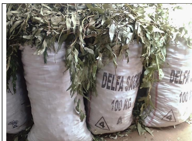
Sac de taille 100 kg (céréales) contenant 60 kg de poivron frais