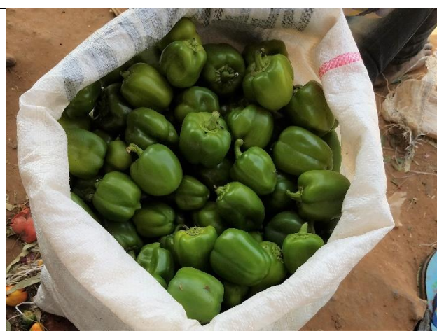
Poivron de Niamey sur le marché de Djémadjé