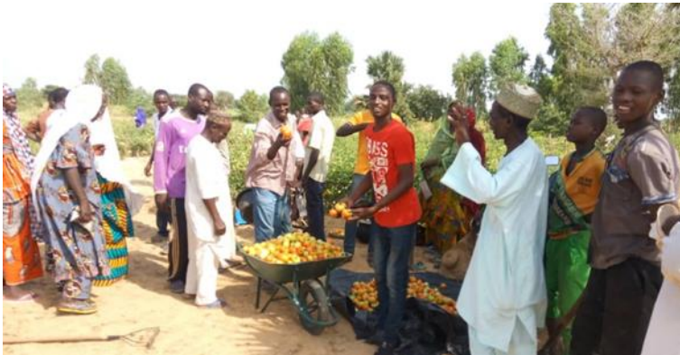
Formation des jeunes agriculteurs sur la production de tomate / Chambre Régionale d'Agriculture de Tahoua.

principalement ravitaillé par les tomates importées des pays côtiers (Nigeria, Ghana, Bénin) et du Maroc.